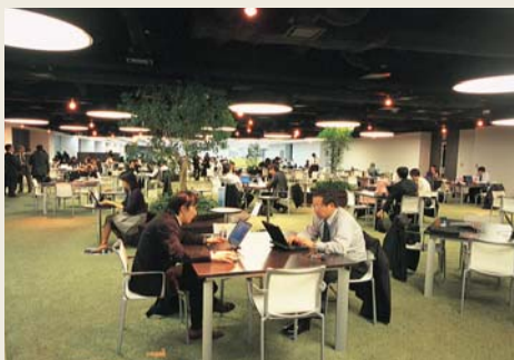
Parkと名づけられたフロア。芝生を模したカーペットが敷かれ、樹木を囲むベンチが点在する