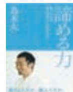
2013年5月発行の『諦める力—勝てないのは努力が足りないからじゃない』（プレジデント社）